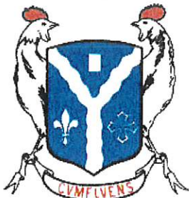
Mairie de COUFFOULEUX